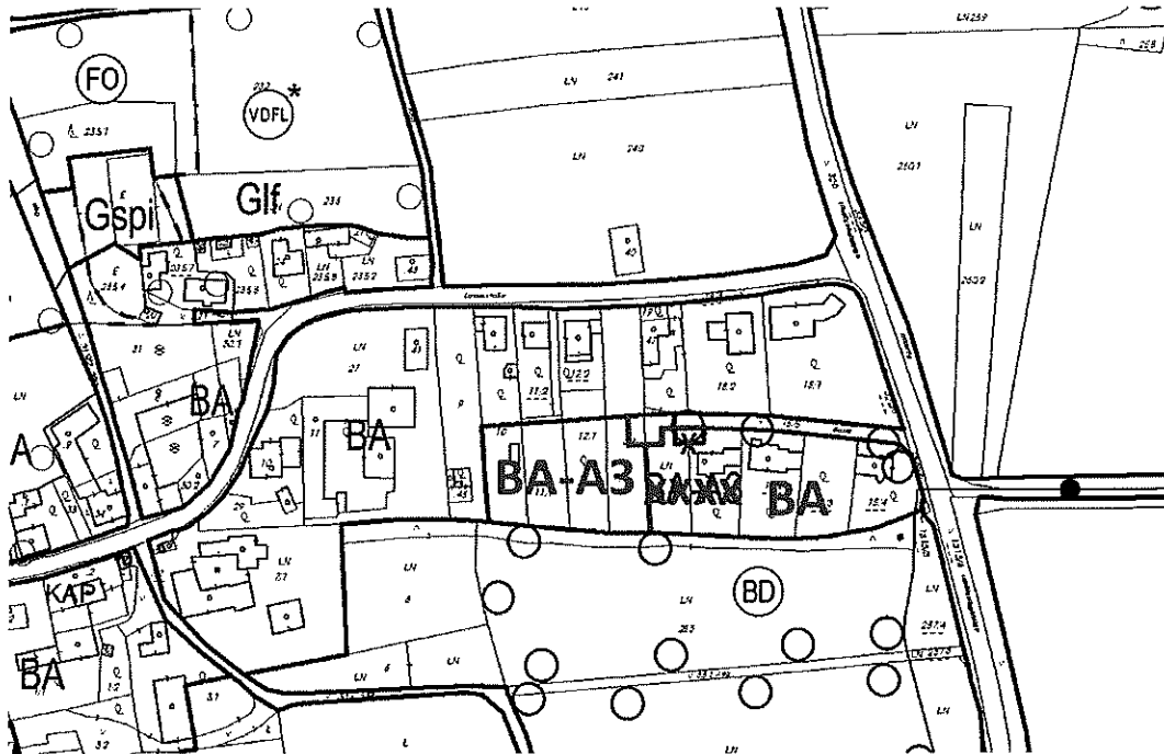
Abbildung 3: Änderungspunkt 3 - Empfehlung Beschlussfassung