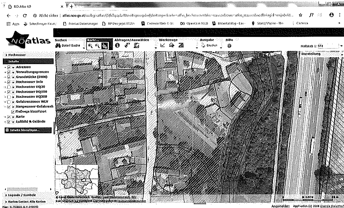
Abbildung 1: Beispiel für die unzureichende Präzision der Hangwasserkarte v.a. im verbauten Gebiet: An diesen beiden Stellen laufen die Fließwege virtuell durch Gebäude durch

Die Oberndorfer Ortsstraße weist einen Kanal auf, in welchem sich die Wässer sammeln und schadlos abgeleitet werden.