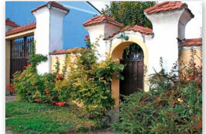
Ober- und Unterwinden