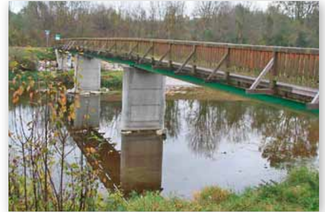
Traisensteg in Oberndorf