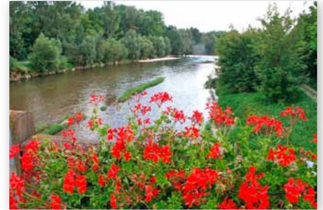
Die Traisen in Einöd