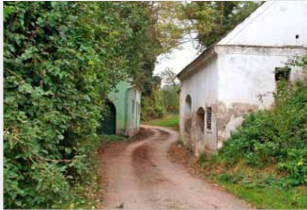
Ober- und Unterhameten