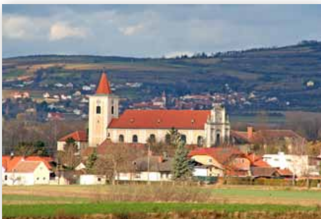
St. Andrä an der Traisen