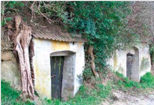
Kellergasse in Adletzberg