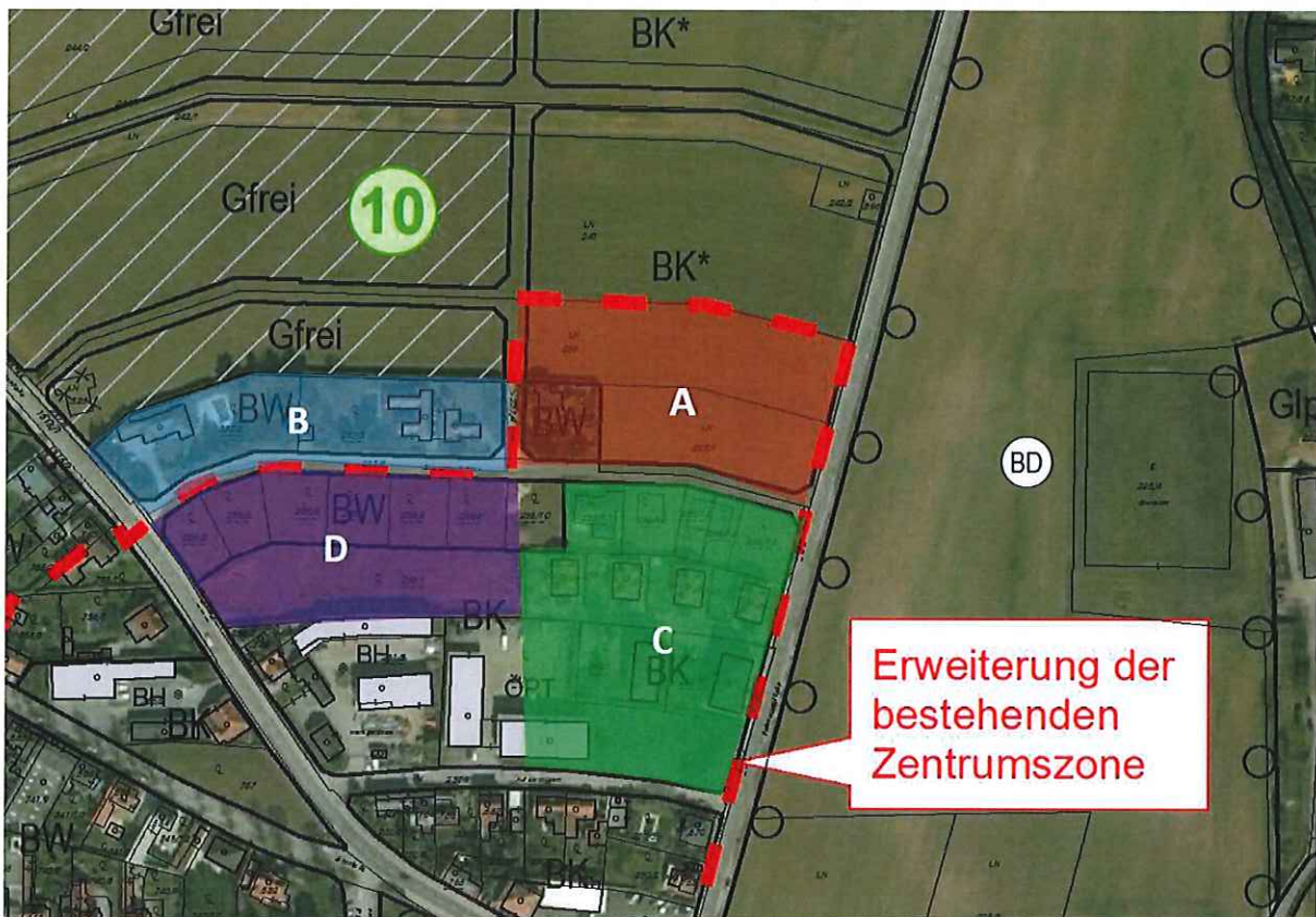
Abbildung 1: Flächenaufstellung im nördlichen Bereich der Erweiterung der Zentrumszone

Der Leitfaden zur Abgrenzung der Zentrumszone (Herausgegeben vom Amt der NÖ Landesregierung, Abteilung RU2 1 ) unterstellt, dass, wenn ein Baublock den Kriterien der Zentrumszone entspricht, die Grundstücke der gegenüberliegenden Straßenseite ebenfalls in die Zentrumszone aufgenommen werden können. Dies ist bei der dargelegten Modifizierung ins Treffen zu führen. Der erwähnte Baublock ist Teil der Zentrumszone. Somit wird die gegenüberliegende Straßenseite (nördlich) ebenfalls in die Zentrumszone aufgenommen.